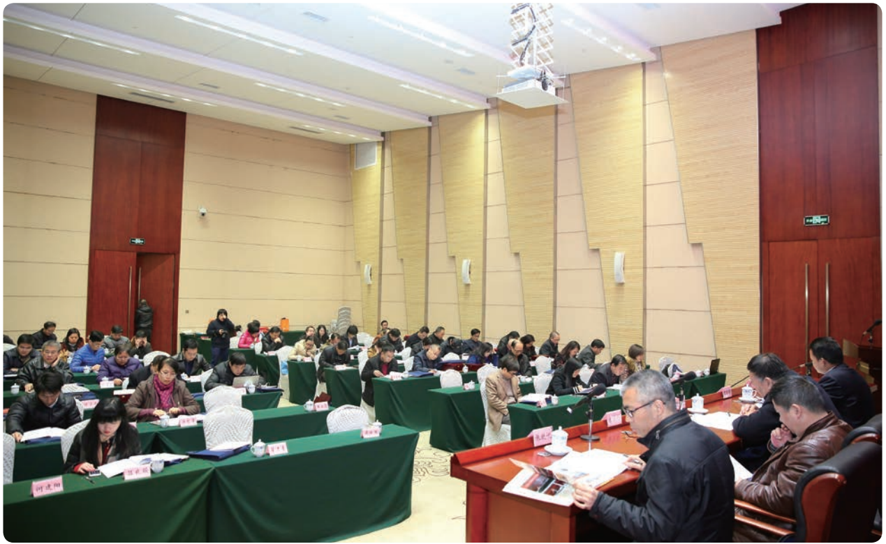
参会代表审阅会议材料