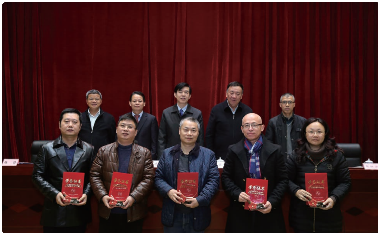
参会领导与杰出代表合影