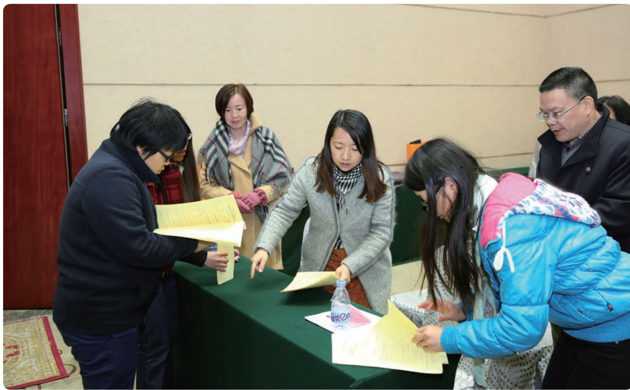
会议表决计票现场