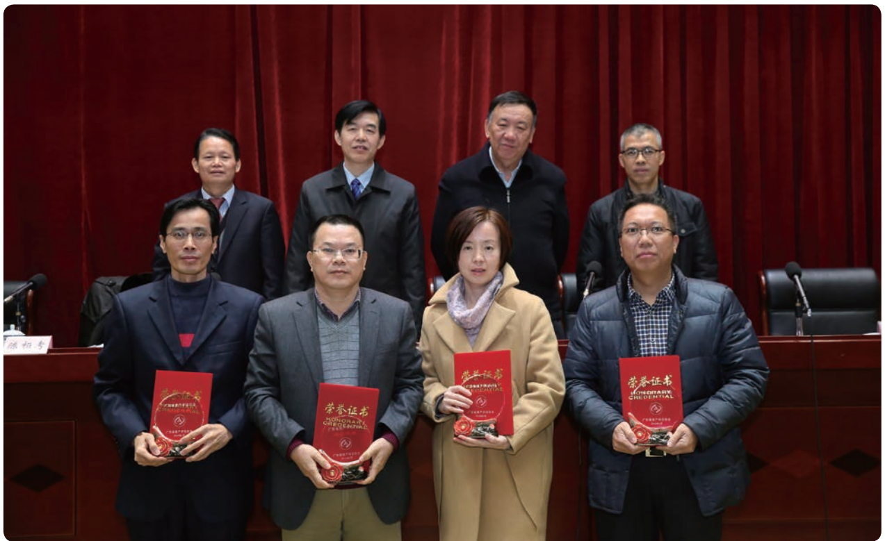
参会领导与杰出代表合影