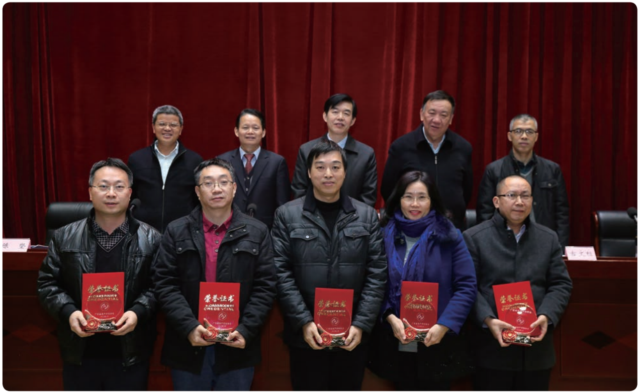
参会领导与杰出代表合影