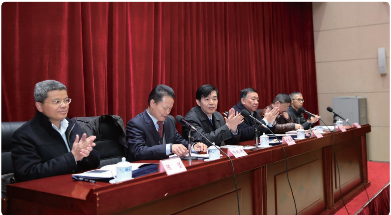
会议主席台就座的领导