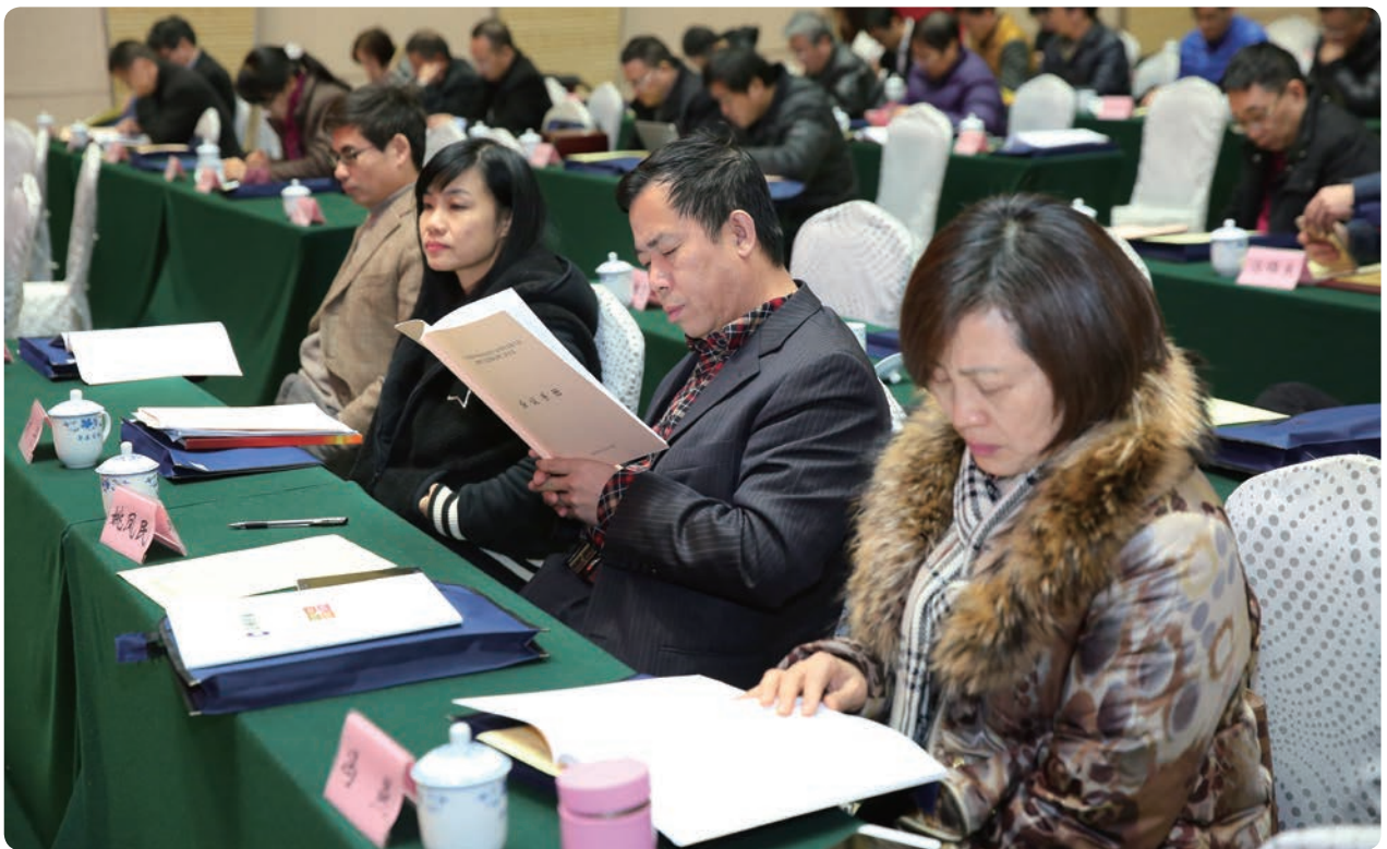
参会代表审阅会议材料