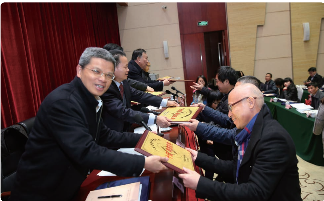
参会领导为“十佳”评估机构颁发奖牌