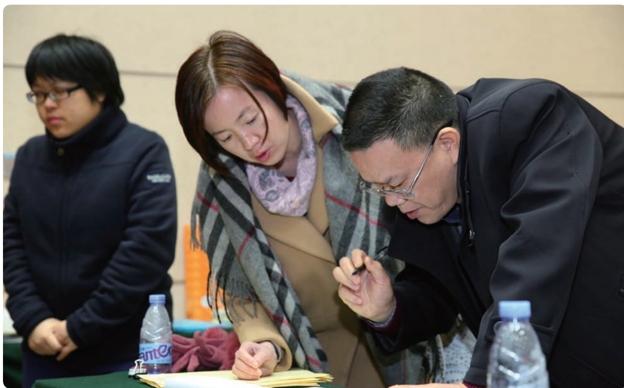
会议表决计票现场