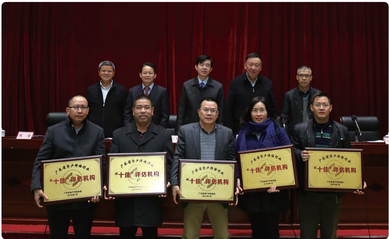
参会领导与“十佳”评估机构负责人合影