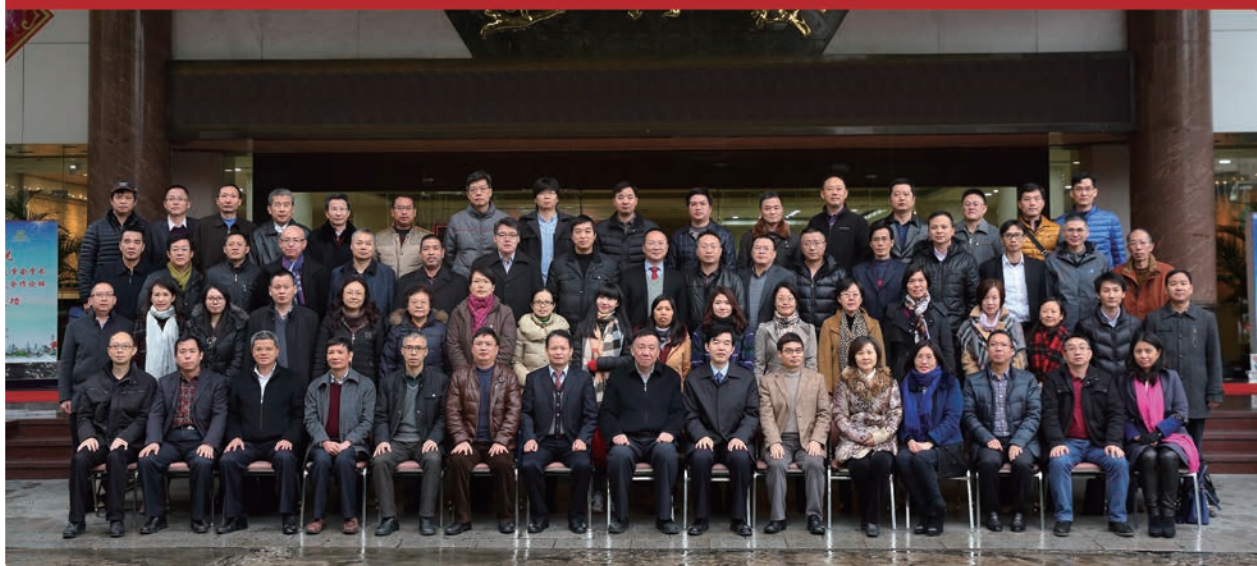
广东省资产评估协会成立20周年总结大会暨第三届理事会第三次会议 2016.01.26 广州