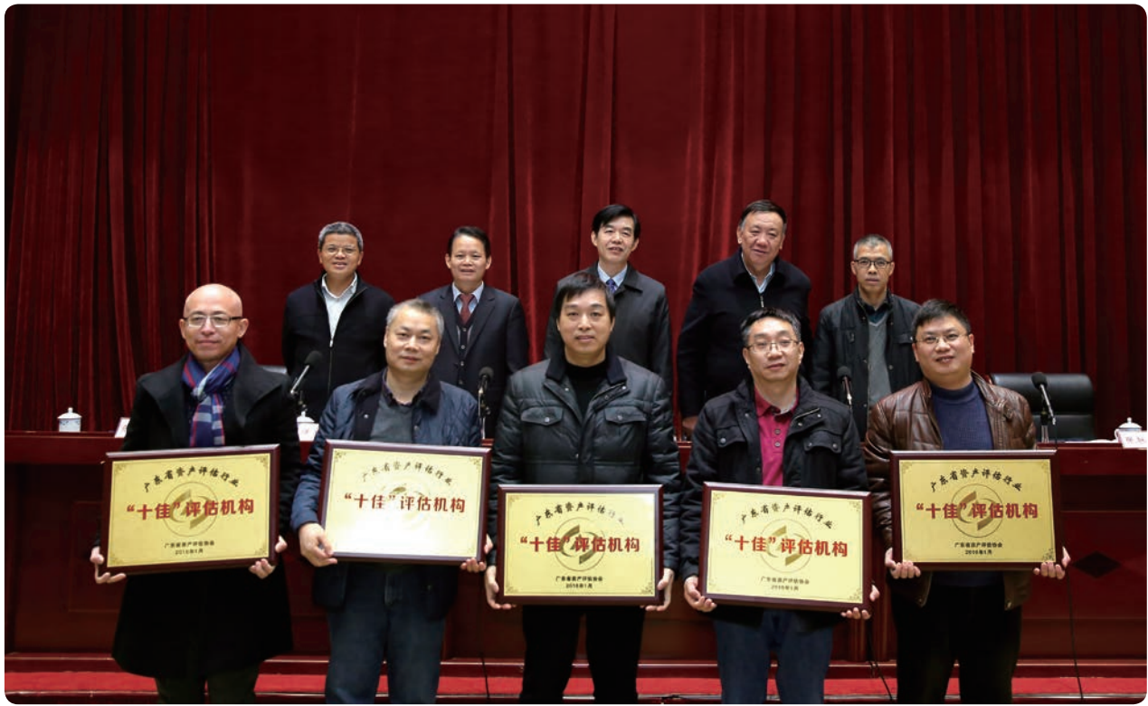
参会领导与“十佳”评估机构负责人合影