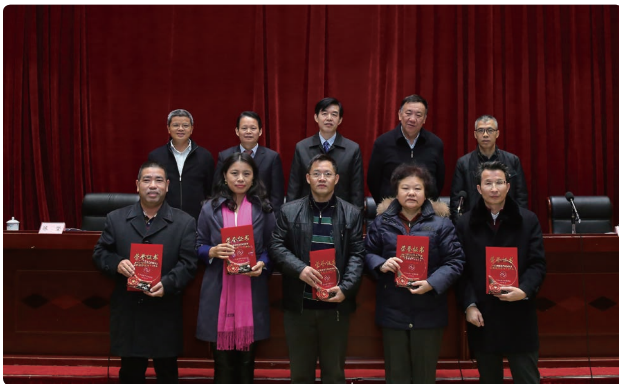
参会领导与杰出代表合影