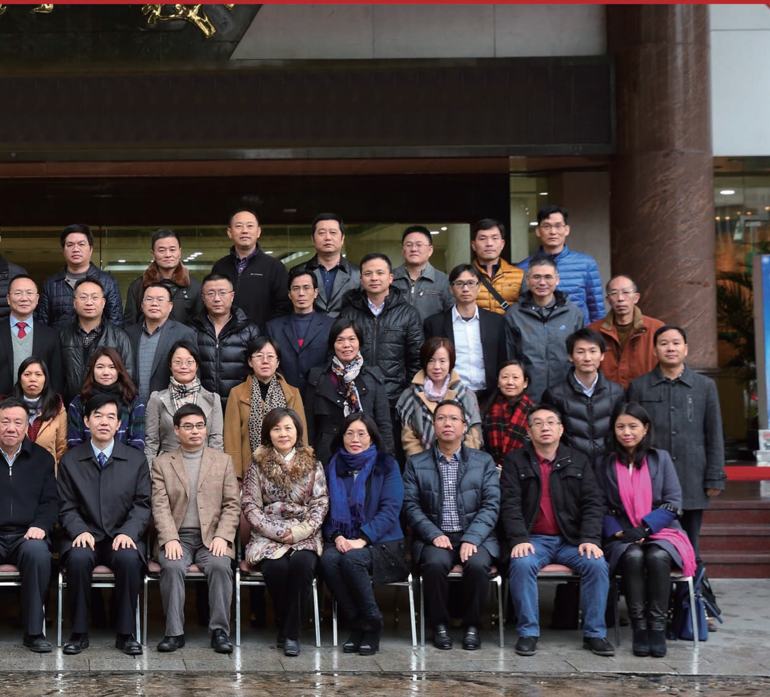
全体参会代表合影